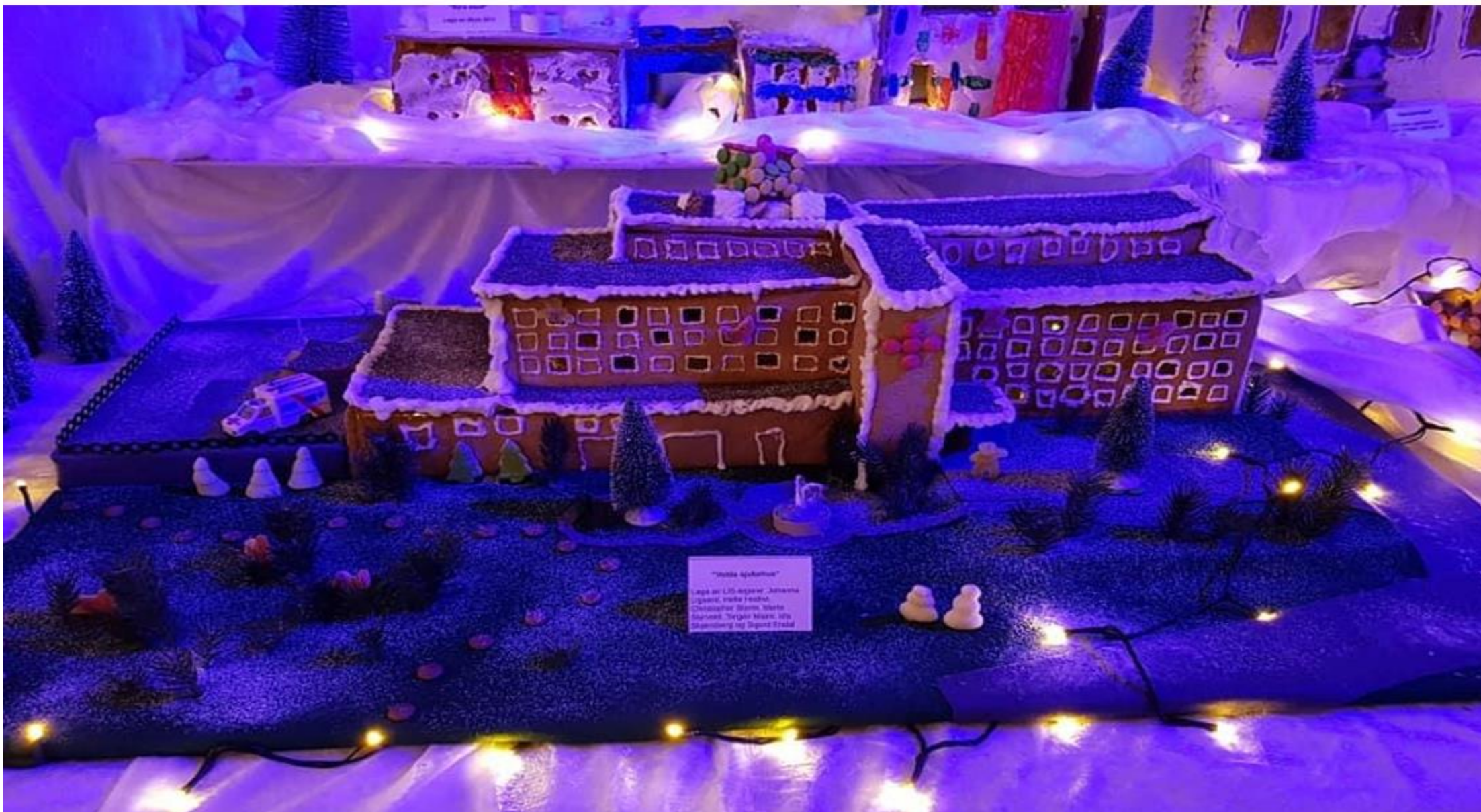
"Hvite Hjortene" Laga av LIS-egget, Ananna Egget, røde ferdig, Chokolade, Saus, Mørk Sjokolade, Toppet Nøst, Iste Krem og Sjokolade