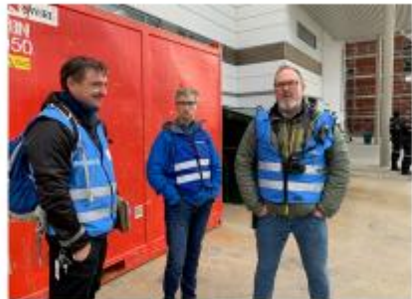
BF Malmefjord, brann i LIB (Litium-ionbatteri)