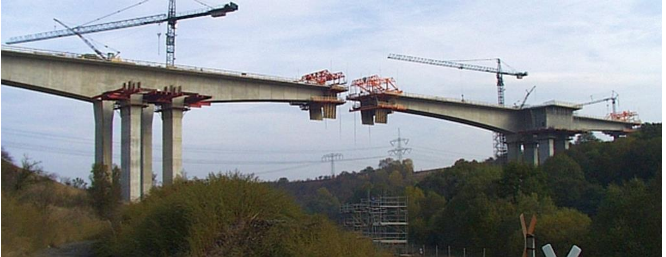
Det svikter i overgangene