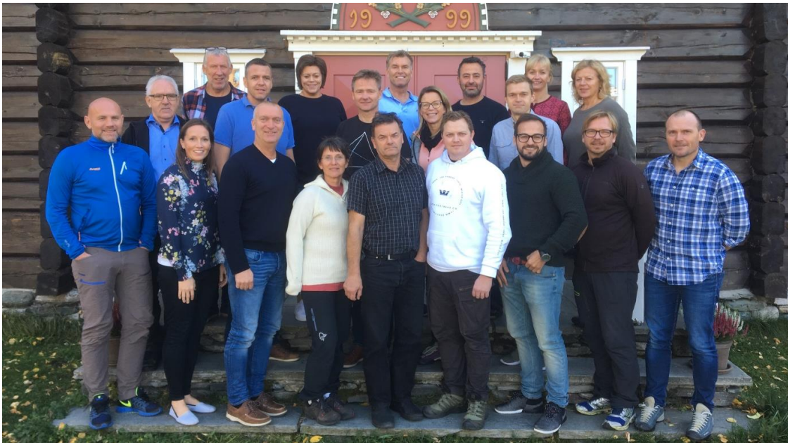
Prosjektorganisasjonen bestående av tilsette frå Helse Møre og Romsdal og Sykehusbygg.

Ta gjerne kontakt dersom du har spørsmål eller innspel til oss i prosjektet. E-post: post.snr@helse-mr.no . For meir informasjon, sjå vår nettside: https://helse-mr.no/om-oss/nytt-sjukehus-snr .