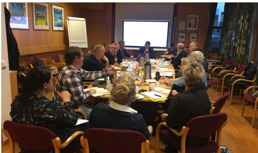
Frå møtet i Kristiansund 8. desember

8. desember blei Kristiansund kommune, ORKidé, Helse Møre og Romsdal og Helseinnovasjonssenteret i Kristiansund einige om å rigge eit felles prosjekt som skal utvikle helsetenestetilbod i det nye distriktsmedisinske senteret i Kristiansund.