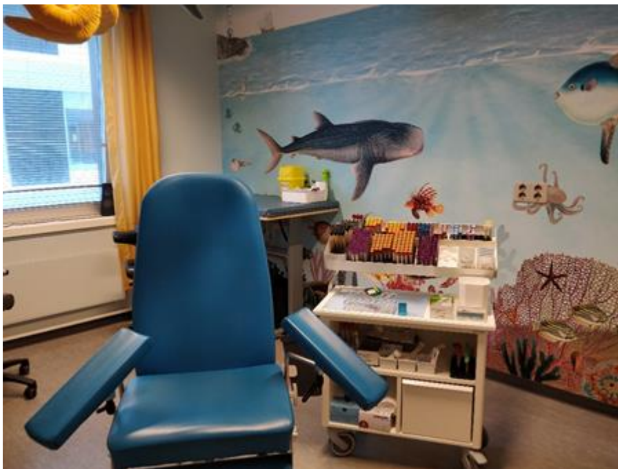
Eitt av dei nyoppussa romma ved prøvetakingspoliklinikken ved Medisinsk biokjemi og blodbank, Ålesund. Dette er spesielt tilpassa for barn som skal ta blodprøver.

Vi veit at mange pasientar og rekvirentar set pris på dette tilbudet, og er glade for at vi kan tilby prøvetaking på kveldstid.