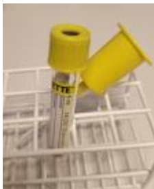
6 ml vakuumsrør til Medisinsk biokjemi og blodbank

Merk at 6 ml-røra berre skal brukast til urinprøver til biokjemiske analyser ved laboratoria i Helse Møre og Romsdal. Prøver til mikrobiologi og cytologi sendast på andre behaldarar som oppgitt nedanfor.