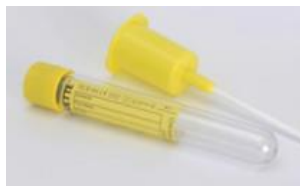
10,5 ml CCM-rør til mikrobiologi