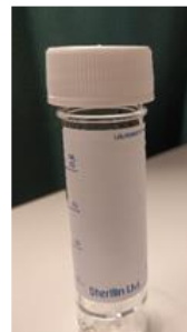
20 ml universalcontainer til patologi (tilsett 50% etanol, halvt om halvt med prøvemengde)