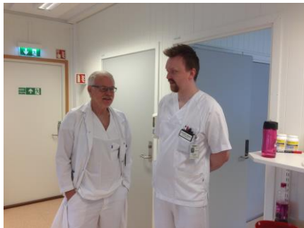
Frå åpninga av «ny» blodbank i Molde

I Molde er blodbanken pussa opp og utvida med nye brakker.